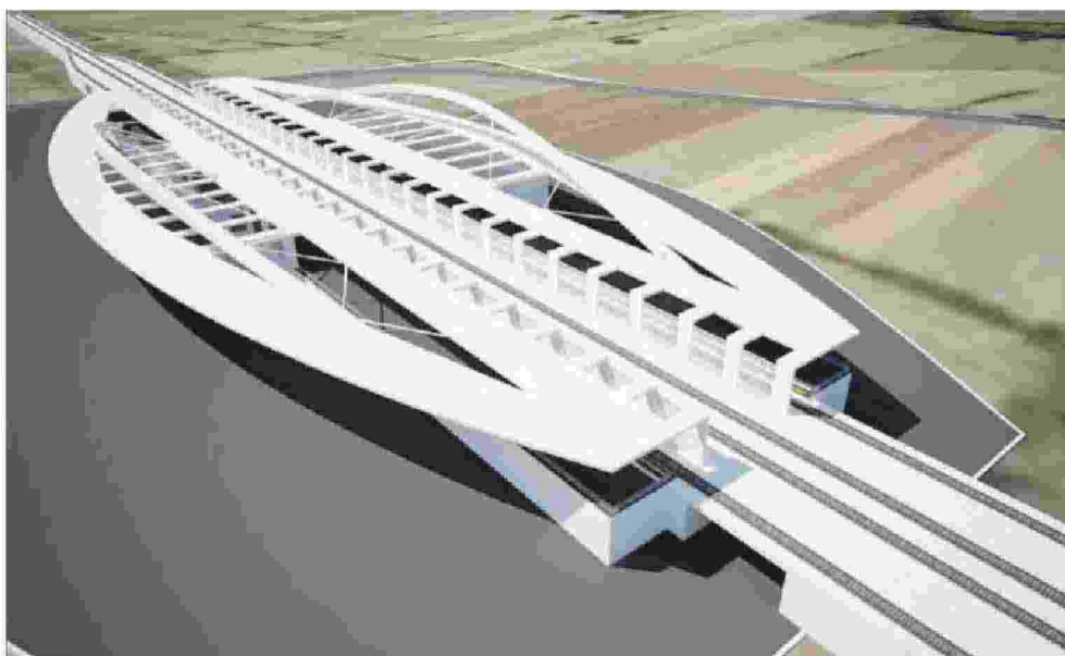
Il rendering della Stazione dell'Alta Velocità che era stata ipotizzata per la provincia di Frosinone