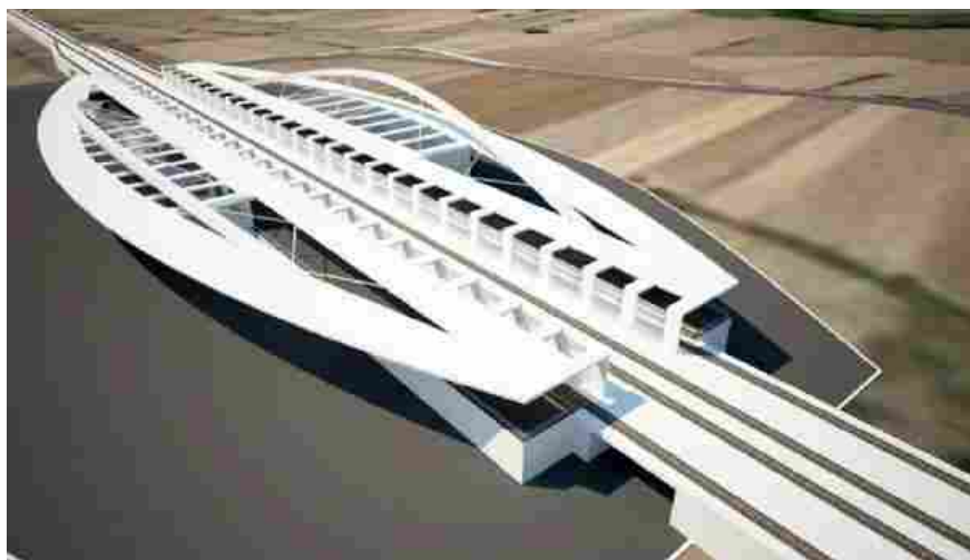
Il rendering della Stazione dell'Alta Velocità che era stata ipotizzata per la provincia di Frosinone

Frosinone - Il tema delle infrastrutture torna centrale. «Importante sapere dalle Ferrovie se il progetto c'è ancora oppure no»