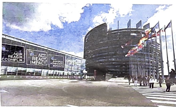
La sede del Parlamento europeo a Strasburgo