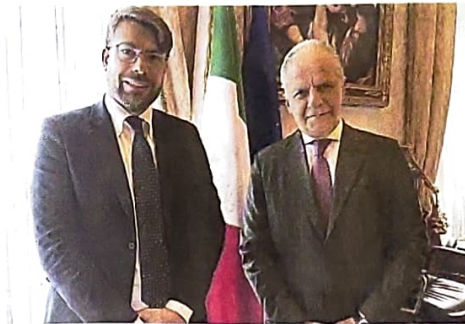
Il presidente della Provincia, Di Stefano, e il ministro Piantedosi

Le angosce e il dolore patiti in quel periodo, così come i gesti di coraggio, eroismo e solidarietà, domani saranno al centro di quella che si preannuncia una suggestiva cerimonia, carica di significato. Oltre al