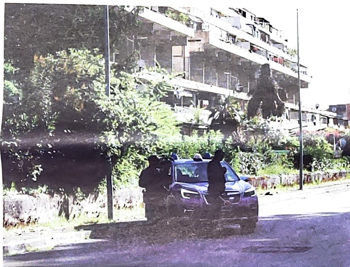
La polizia di Stato impegnata nell'operazione di recupero degli appartamenti Ater occupati abusivamente al Casermone di Frosinone