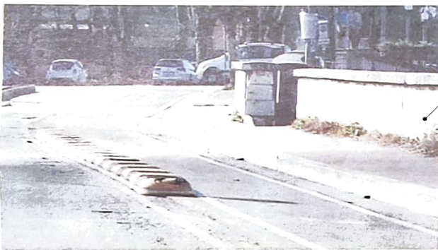
Qui accanto uno dei tratti della pista ciclabile realizzati in centro ma non ancora inaugurati

Nei giorni scorsi la giunta ha approvato il progetto di fattibilità tecnico-economica predisposto