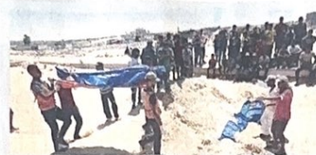
Tragedie. Un funerale palestinese a Khan Yunis, nel sud della striscia di Gaza