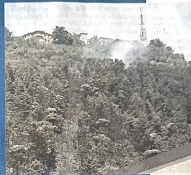
Nella foto grande un mezzo del servizio antincendio regionale intervenuto sull'emergenza incendi che ha interessato Fumone; nella foto a destra un'area boschiva devastata dalle fiamme

clude il primo cittadino- non è stato ritenuto idoneo al finanziamento. Vorremmo capire se ci siano margini per qualche finanziamento regionale». La riunione, comunque, è stata fruttuosa anche sul fronte operativo, con alcune decisioni che verranno attuate nell'immediato come, ad esempio, un sopralluogo congiunto che dovrebbe tenersi oggi tra i tecnici comunali e quelli dell'amministrazione provinciale