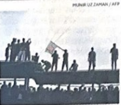
Rivolta. Studenti all'università di Dhaka