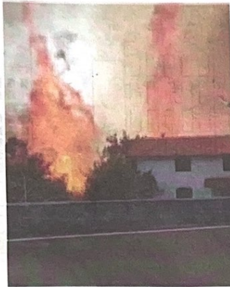
Un'immagine delle fiamme del devastante incendio divampato venerdì scorso a Fumone