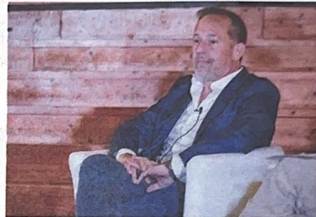
L'assessore al Bilancio Giancarlo Righini

«Abbiamo invertito questa tendenza, in un solo anno di Governo riducendo di mezzo miliardo il debito regionale, abbiamo avuto per la prima volta un upgrade dalle agenzie di rating e Moody's ci ha premiato. Non contraiamo più un nuovo debito e investiamo le risorse in maniera oculata», ha concluso Righini. ●