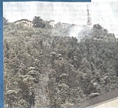
Nella foto grande un mezzo del servizio antincendio regionale intervenuto sull'emergenza incendi che ha interessato Fumone; nella foto a destra un'area boschiva devastata dalle fiamme

clude il primo cittadino- non è stato ritenuto idoneo al finanziamento. Vorremmo capire se ci siano margini per qualche finanziamento regionale». La riunione, comunque, è stata fruttuosa anche sul fronte operativo, con alcune decisioni che verranno attuate nell'immediato come, ad esempio, un sopralluogo congiunto che dovrebbe tenersi oggi tra i tecnici comunali e quelli dell'amministrazione provinciale