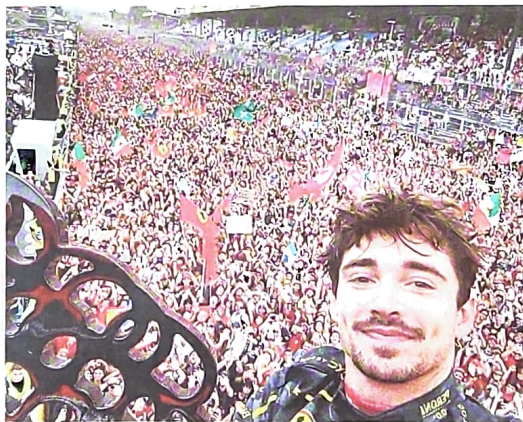
Il selfie Charles Leclerc, 26 anni, ringrazia i tifosi: "Siete i numeri!"