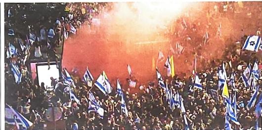
Tel Aviv In piazza contro il governo Netanyahu

alle pagine 4 e 5 servizi di Baroud, Basile Castellani Perelli e Tercatin alle pagine 4, 6 e 7