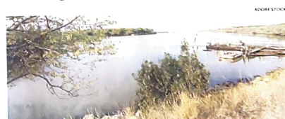
Il fiume Po. Una delle aree più ricche di biodiversità del nostro Paese