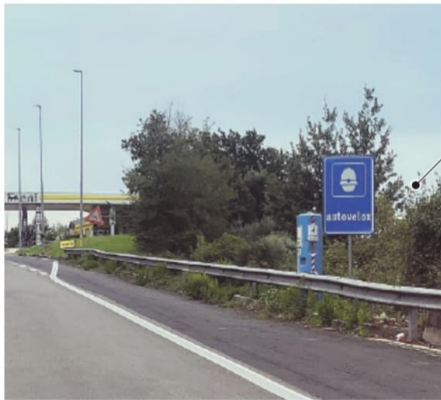
Il dispositivo posizionato sabato scorso nel tratto di Veroli della superstrada in direzione Sora

Pochi giorni fa una macchina, guidata da un uomo, è uscita fuoristrada ribaltandosi nel terreno a ridosso della carreggiata, poco distante dal distributore di carburante. Il condu-