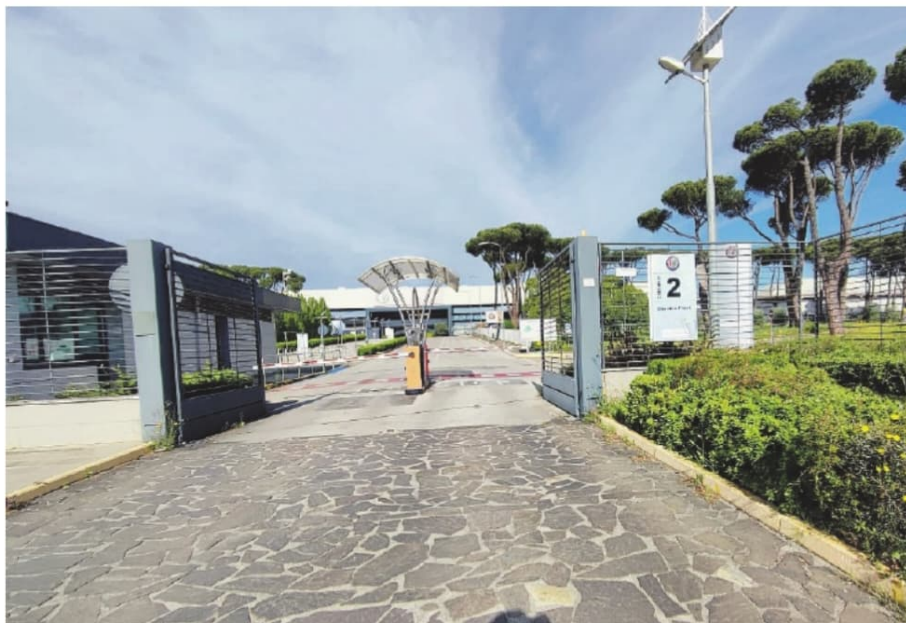
L'ingresso dello stabilimento di Cassino

Dalla produzione di Stellantis e dalla sua sopravvivenza dipende anche la salvezza dell'indotto. «L'auto elettrica - continua Salera - è stato un flop assoluto in termini di vendite mentre riduce fortemente la necessità di componenti dall'indotto. Anche in Germania si stanno prendendo decisioni drastiche ecco perché dico che va sostenuta la produzione con incentivi rivolta alla produzione italiana, è l'unica salvezza. Ora però dobbiamo sentire i sindacati a valutare anche tutti i loro suggerimenti e le loro indicazioni, poi porteremo tutto all'attenzione del governo, questo è lo spirito».