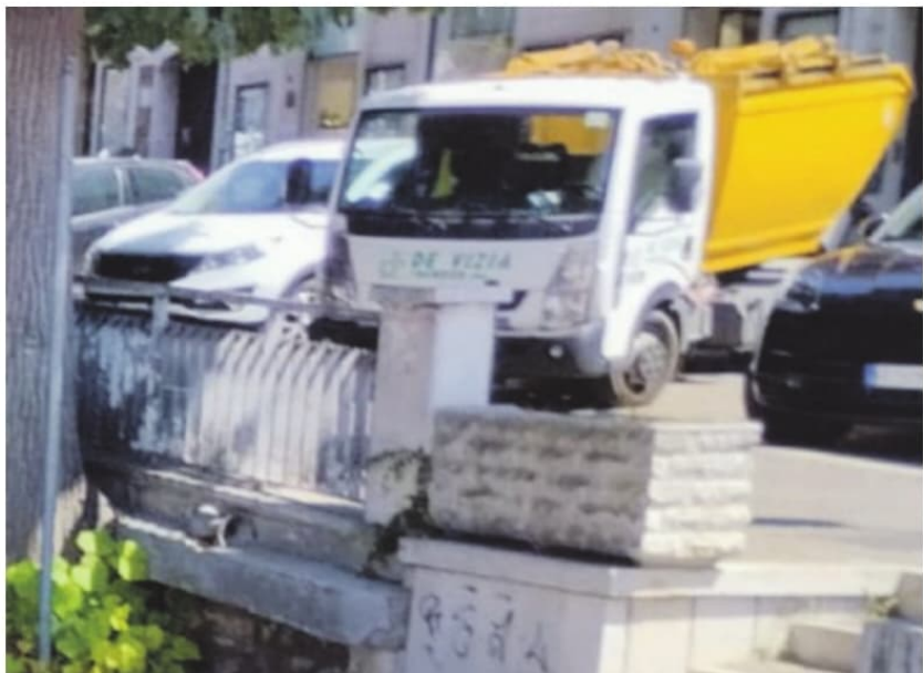
Un mezzo della De Vizia