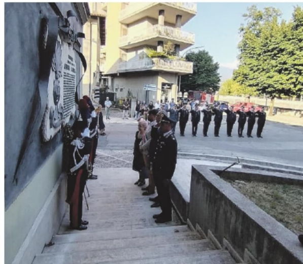
Un momento della cerimonia dello scorso anno

Nel pomeriggio, alle 17, presso il monumento ad Alberto La Rocca nel cimitero di Sora, la cerimonia militare con la deposizione di una corona di alloro; stessa cosa