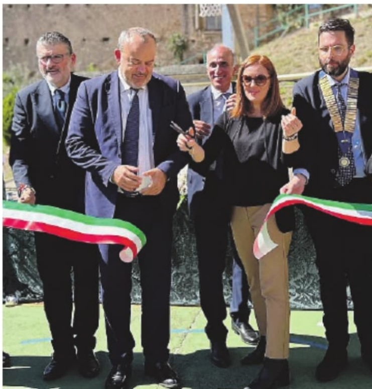
Il presidente Antonello Aurigemmma alla cerimonia inaugurale

«Siamo felici di essere qui per l'inaugurazione dell'anno scolastico - ha detto il presidente Aurigemmma - Si tratta di un vero riferimento per il territorio. La scuola ha un ruolo sempre più importante, sia come luogo di insegnamento che di socializzazione. Soprattutto in un momento in cui ci sono stati molti cambiamenti nella società, a partire dall'innovazione tecnologica. Come istituzioni, dobbiamo fornire un adeguato supporto per garantire alle famiglie la libertà di scelta educativa verso i propri figli. In tal senso, il nostro impegno è anche quello di rivedere la legge regionale 7 del 2020, e per farlo è necessario portare avanti il giusto confronto, coinvolgendo