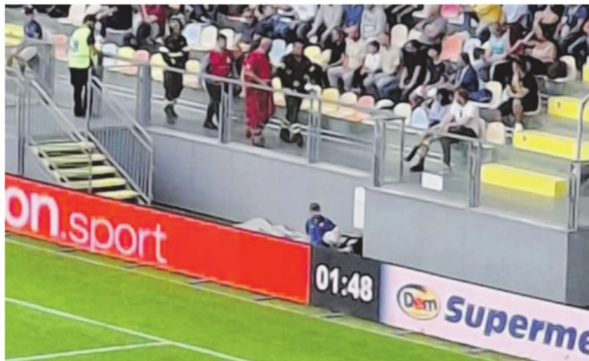
I momenti successivi allo scoppio del petardo