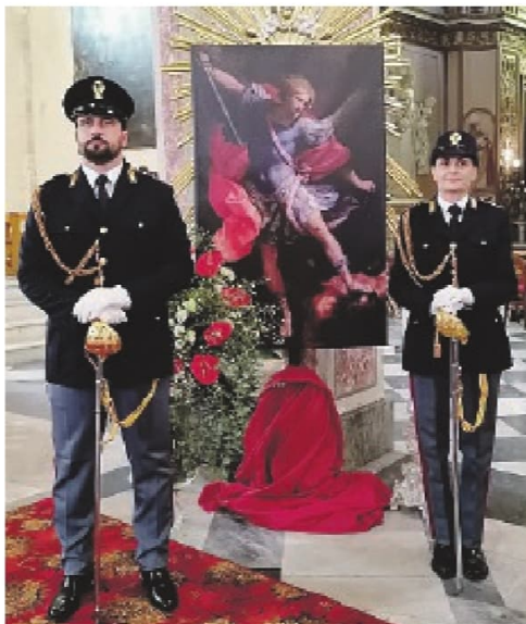
Una precedente festa di San Michele

E, come tutti gli anni, in onore di San Michele Arcangelo, patrono della polizia di Stato, che si festeggia il 29 settembre, ci sarà una funzione religiosa con la partecipazione del que-