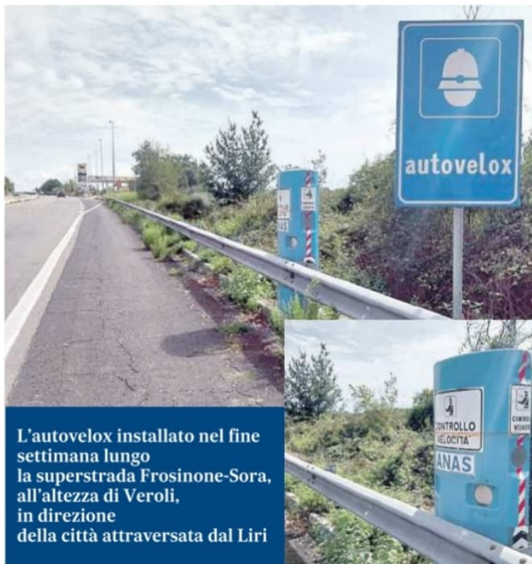
L'autovelox installato nel fine settimana lungo la superstrada Frosinone-Sora, all'altezza di Veroli, in direzione della città attraversata dal Liri

Alle migliaia di persone che viaggiano sulla statale 214 "Maria e Isola Casamari" non è sfuggita quella colonnina azzurra, impiantata nelle ultime ore oltre il guardrail, alta circa un metro e mezzo e con tanto di vetrini fron-