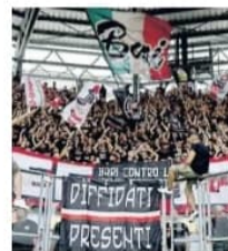
I tifosi del Bari allo Stirpe

Bomba carta, vigile del fuoco rischia un timpano