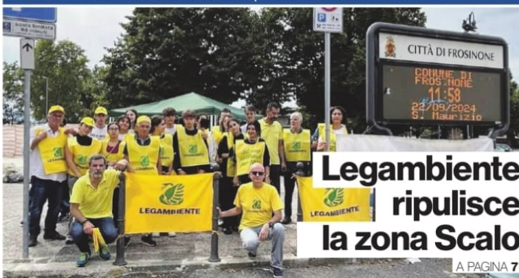
Foto di gruppo per i volontari di Legambiente che hanno partecipato all'annuale edizione di "Puliamo il mondo"