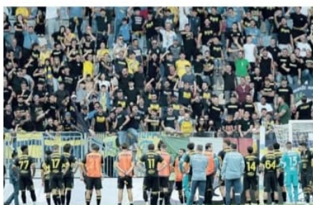
La squadra contestata dai tifosi della Curva Nord