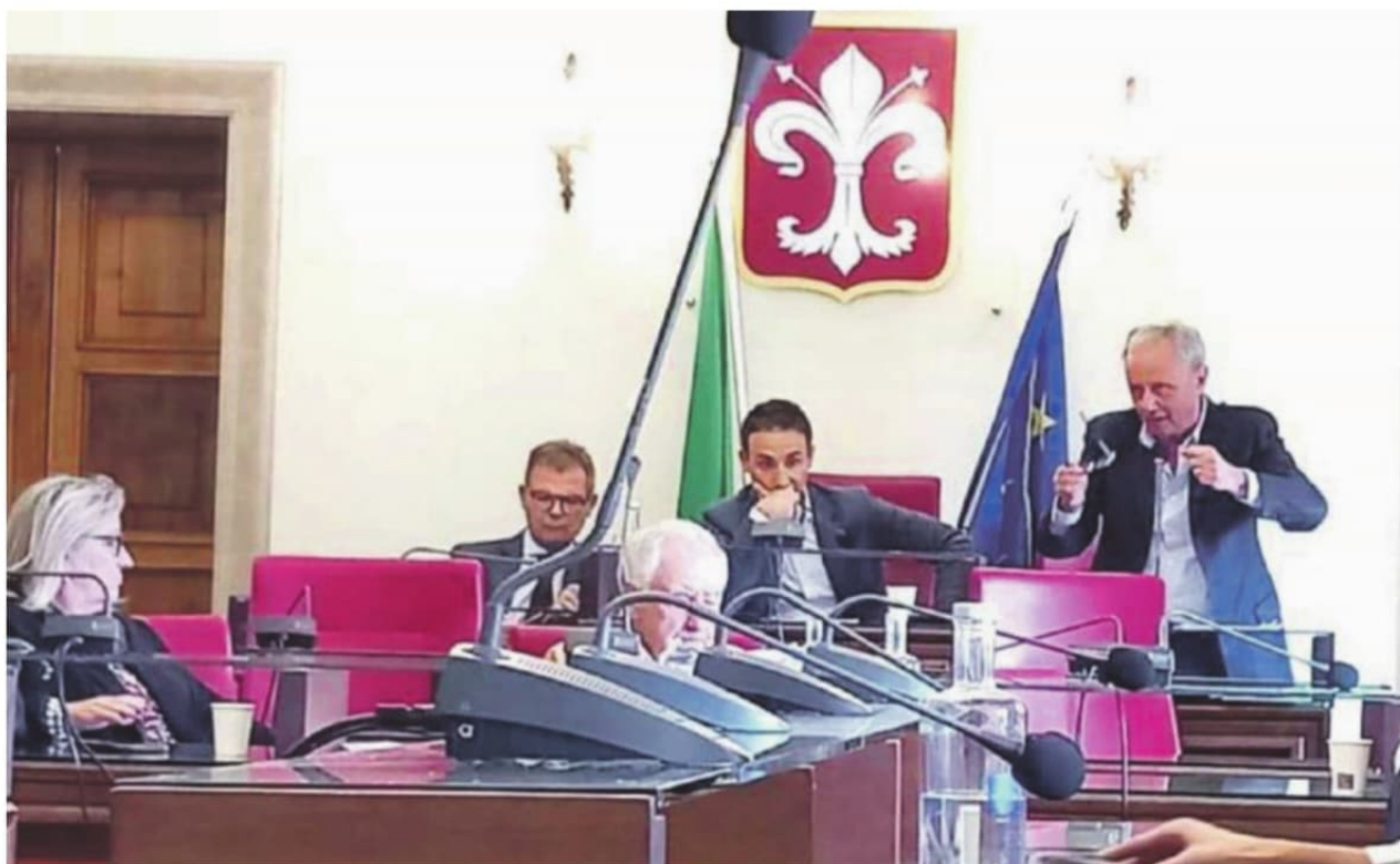
Un momento del consiglio comunale di Ferentino