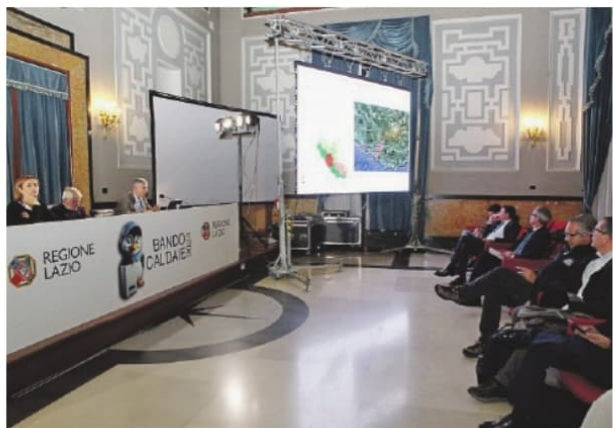
Alcuni momenti del convegno organizzato dall'assessorato regionale all'ambiente, ai cambiamenti climatici, alla transizione energetica e alla sostenibilità che si è svolto ieri pomeriggio nel salone di rappresentanza della Provincia per illustrare il "Bando Caldaie 2024"