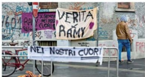
▲ Sui muri Striscioni e scritte per ricordare Ramy, morto a Corvetto

di De Riccardis e Di Raimondo a pagina 13