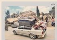
Baalbeck. Libanesi tornano a casa

Nel 2023 i cittadini stranieri, comunitari e non, presenti nelle banche dati dell'Inps erano 4,3 milioni. L'87,2%, più di 3,8 milioni, di loro lavoro, il 7,3% è pensionato, il 5,6% riceve un sostegno al reddito. — a pagina 10