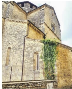
L'edera sulla chiesa di S. Maria Maggiore

turistico, la città d'arte potrà avere chance di rinascita. In caso contrario sarà molto difficile, se non impossibile. In questi giorni alcuni cittadini hanno segnalato inconvenienti tecnici riguardanti l'abbazia di Santa Maria Maggiore: la mancanza di un discendente di scarico delle acque piovane, che se non sistemato subito potrebbe portare infiltrazioni all'interno, e la ramificazione di edera su un'altra facciata della stessa abbazia gotico-cistercense edificata nel lontano 1135. Per quanto riguarda il discendente, presto interverrà il Comune, come assicurato dal sindaco Fiorletta, per la sistemazione del tu-