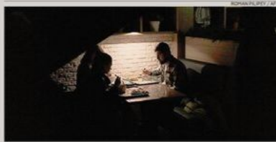
Blackout. Niente elettricità dopo un attacco russo: a Kiev si cena al buio

Ucraina, la Germania schiera in Polonia i missili Patriot