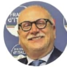
Il deputato di Fratelli d'Italia Aldo Mattia e a lato la discarica di via Le Lame

riunito tutti gli attori coinvolti per definire i dettagli della consegna del sito. Un lavoro che ha visto l'impegno costante dell'assessore regionale alla Tutela del territorio e al ciclo dei rifiuti, Fabrizio Gherra, insieme alle amministrazioni locali, in un percorso di concreta operatività.