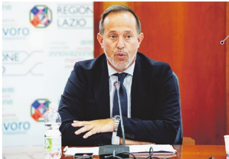
L'assessore regionale all'agricoltura Giancarlo Righini

Il secondo bando, dal valore di 27 milioni di euro, è destinato agli "Investimenti per la trasformazione e commercializzazione dei prodotti agricoli". L'intervento ha come obiettivo quello di promuovere la crescita economica delle aree rurali attraverso un'azione di rafforzamento della produttività, redditività e competitività sui mercati agricolo, agroali-