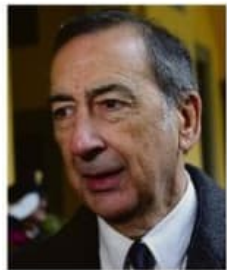
LA RESA Il sindaco Beppe Sala