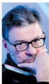
IMPEGNO Il ministro Giancarlo Giorgetti