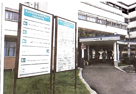
Nuovo importante reparto aperto all'Asl di Frosinone