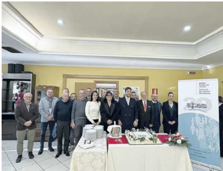
Un momento della giornata

L'evento è stata un'occasione per ricordare la storia dell'Aipes, il consorzio più "anziano"