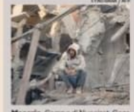
Macerie. Campo di Nuseirat, Gaza