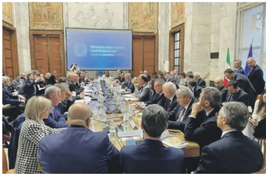
L'incontro di ieri al ministero sul Piano Italia

sfazione per l'esito del tavolo. A nome del gruppo Stellantis, Jean-Philippe Imparato, ha preso impegni precisi con il governo italiano garantendo investimenti a lungo termine, sia sul mantenimento di tutti i siti produttivi, sia sulla tutela dei livelli occupazionali. In particolare, ha spiegato che Cassino avrà un ruolo centrale nello sviluppo di Stellantis in Italia. A Piedimonte saranno prodotte la nuova Stelvio da fine 2025, la nuova Giulia nel 2026 e nel 2027 il nuovo modello top di gamma. Ga-