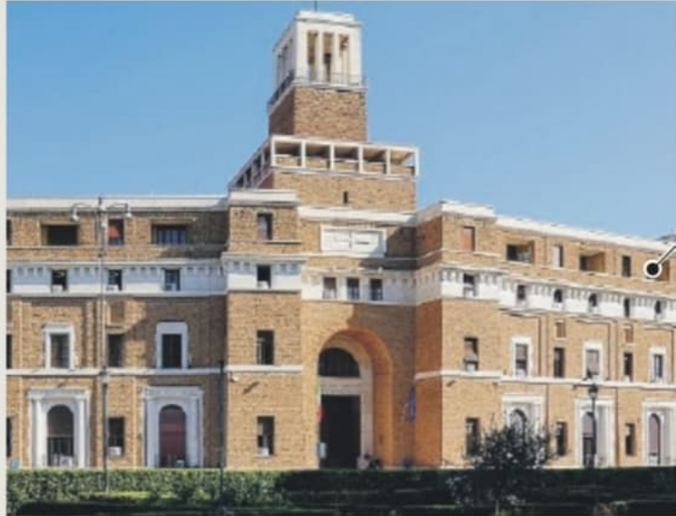
Il palazzo della Procura generale della Repubblica che ospita la Procura europea