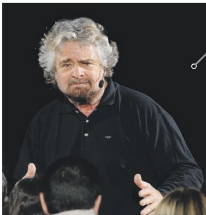
I fedelissimi di Beppe Grillo hanno costituito il gruppo "Figli delle stelle"

Anche le linee programmatiche sono quelle originali del movimento: "Promuovere la partecipa-