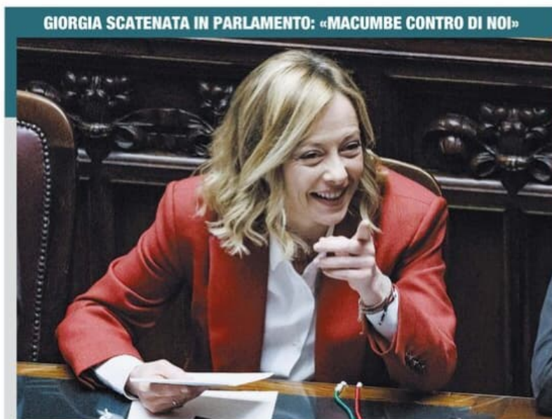
GIORGIA SCATENATA IN PARLAMENTO: «MACUMBE CONTRO DI NOI»

L'Ue prepara una lista di "Paesi sicuri" per i rimpatri. Così le sentenze contro i nuovi centri decadrebbero automaticamente. Panico nel Pd