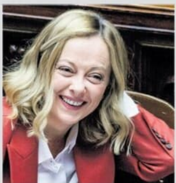
DECISA La premier Giorgia Meloni ieri in Parlamento