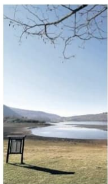
Uno scorcio del lago di Canterno

la Riserva naturale regionale del lago di Canterno, infatti, è un microcosmo le cui funzioni ecologiche sono fondamentali sia come regolatori del regime delle acque, sia come habitat di una particolare flora e fauna. Sono anche luoghi di grande bellezza e perciò visitabili in ogni stagione per svolgere escursioni naturalistiche e birdwatching. La Riserva Naturale del Lago di Canterno è stata istituita dalla Regione Lazio con legge regionale emanata anche questa nel 1997 e si estende per circa 1824 ettari in un territorio che ricade nei Comuni di Ferentino, Fuggi, Fumone, Trivigliano e Torre Caj-