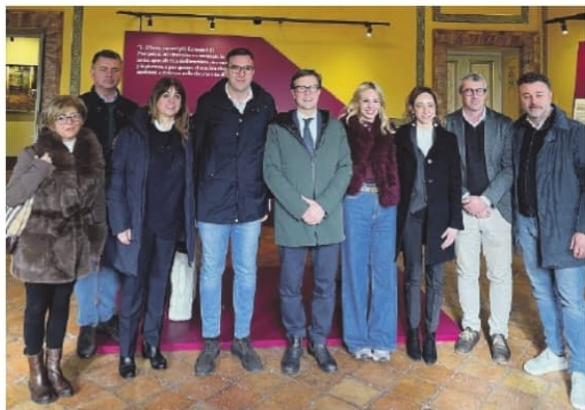
Il "tour" di Dario Nardella in Ciociaria è cominciato a Paliano, con la visita a un'azienda agricola (nella foto a destra), per poi proseguire a Veroli, al museo nazionale dei popoli italici (foto a sinistra). Infine l'appuntamento al polo del freddo a Ferentino (nella foto in basso)