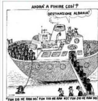
FUN ZIO NE RAN NO! FUN ZIO NE RAN NO! FUN ZIO NE RAN NO!