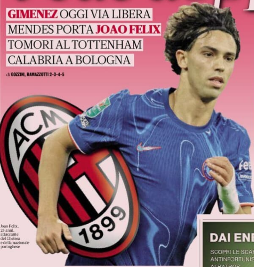
Joao Felix, 25 anni, attaccante del Chelsea e della nazionale portoghese

Sorteggi Champions, è andata malissimo a Juve e Milan. Speravano in un avversario più abbordabile e invece non si affronteranno