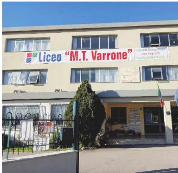
Il liceo «Varrone»