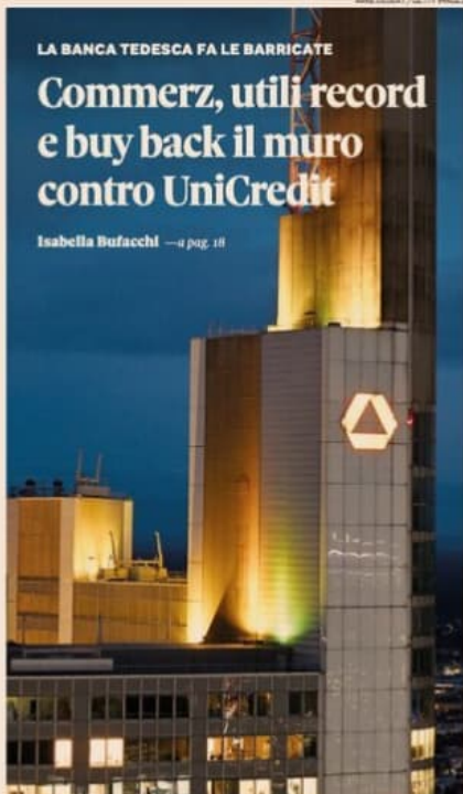
Mosse difensive. La sede del quartier generale di Commerzbank