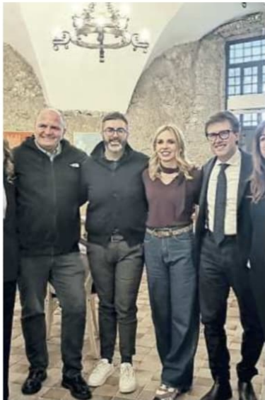
L'incontro a Veroli