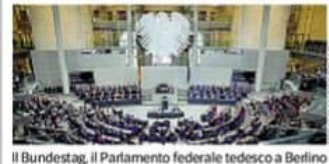
Il Bundestag, il Parlamento federale tedesco a Berlino