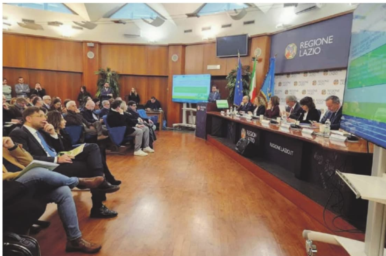
La riunione sui fondi per l'efficientamento energetico nella "Sala Tevere" della Regione Lazio