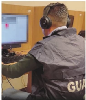
L'inchiesta della Finanza