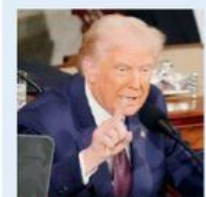
ANTONIUCI E IACCARINO A PAG. 8

Trump ora taglia l'intelligence. Kiev torna a Canossa