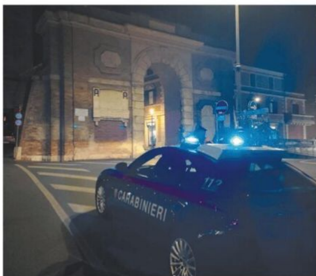
Vasta attività dei carabinieri tra Monterotondo e Mentana