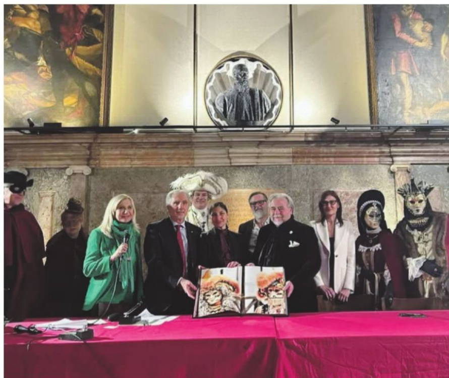
Un momento della presentazione del volume di Massimo De Santis "Venezia, la magia delle maschere" nella sede dell'Ateneo Veneto di Scienze, Lettere e Arti

Un volume che è una vera e propria opera d'arte