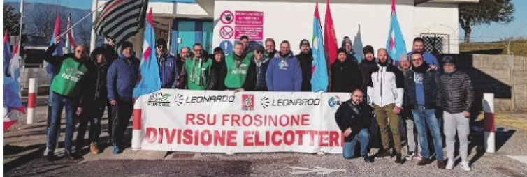
I lavoratori della Leonardo di Frosinone durante lo scorso sciopero dei metalmeccanici. Riflettori anche su Stellantis e sull'indotto