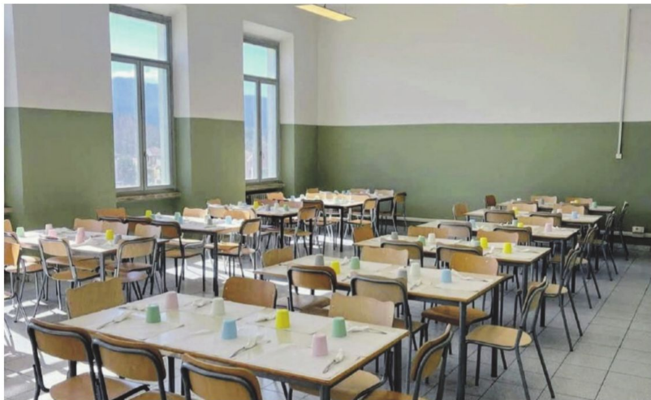
Riaperto il refettorio della scuola Colasanti a Ceprano