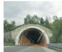
La galleria Capo di China

gola alle migliaia di persone giunte al ri-nome Giardino. Il sindaco ha annunciato che il rogo del fantoccio del generale non ci sarebbe stato. È stato poi bruciato altrove. Russo a pag. 58