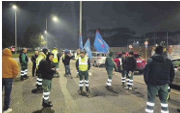
Una delle proteste della De Vizia fuori dai cancelli Stellantis

Oggi la tappa di aggiornamento tra le parti e la speranza che si giunga a individuare una strada maestra per i 32 padri di famiglia che hanno iniziato la