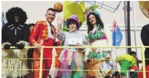
Il carro allegorico dell'associazione di volontariato Afas di Monte San Giovanni Campano