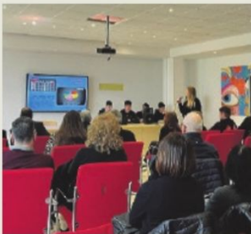
Un momento dell'incontro