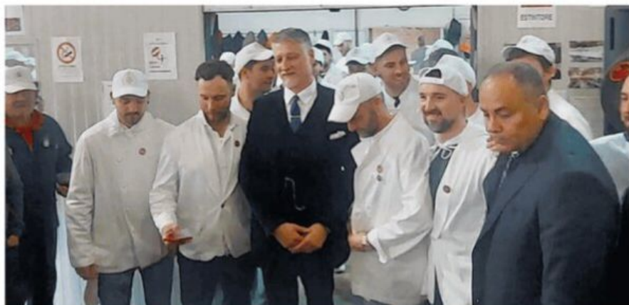
Il ministro Alessandro Giuli ha partecipato ieri al pranzo quaresimale organizzato dalla Fratellanza di Gradoli