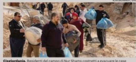
Cisgiordania. Residenti del campo di Nur Shamsa costretti a evacuare le case

GUERRA IN MEDIO ORIENTE Usa trattano con Hamas il rilascio degli ostaggi Idf in Cisgiordania —Servizi a pag. 25 — con l'analisi di Ugo Tramballi