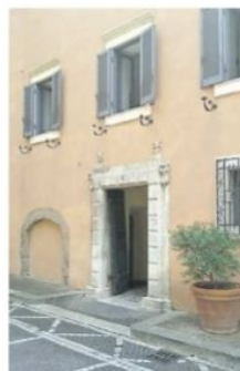
Il Comune di Ceccano