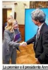
La premier e il presidente Anm

Palazzo Chigi termina con un nulla di fatto l'incontro fra il Governo e l'Anm. Feltoni insiste: andremo avanti con la riforma. Ma smentisce di voler togliere ai pm il controllo della polizia giudiziaria. Deluse le toghe, che restano in mobilitazione.