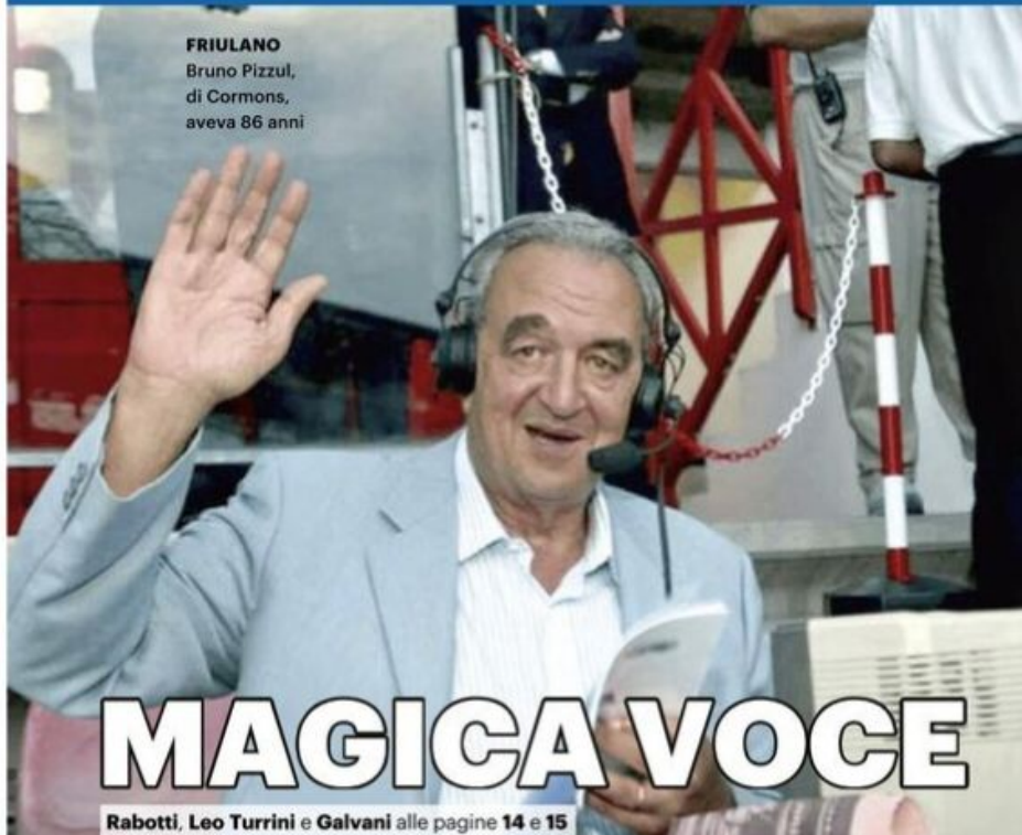
FRIULANO Bruno Pizzul, di Cormons, aveva 86 anni

ADDIO A BRUNO PIZZUL, STORICO TELECRONISTA DELLA NAZIONALE IL FIGLIO: «AVEVA ITALIA '90 NEL CUORE». CAPELLO: «UN MAESTRO»