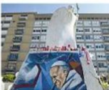
L'opera del messicano Marquez al Gemelli

AL GEMELLI Il Papa è stabile, nessuna crisi L'omelia dedicata alla morte